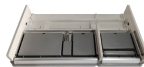
Рама стола со столешницей